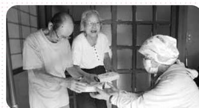
一人暮らし高齢者・高齢者世帯等へおはぎ・ぼたもち配食サービス事業