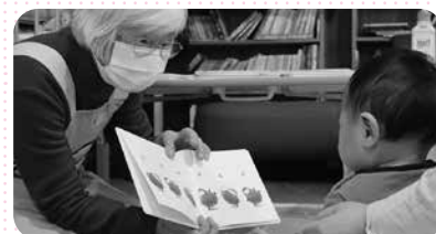
ブックスタート事業