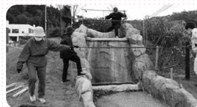
ボランティア活動イルミネーション設置