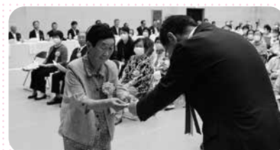
米寿高齢者の記念品贈呈