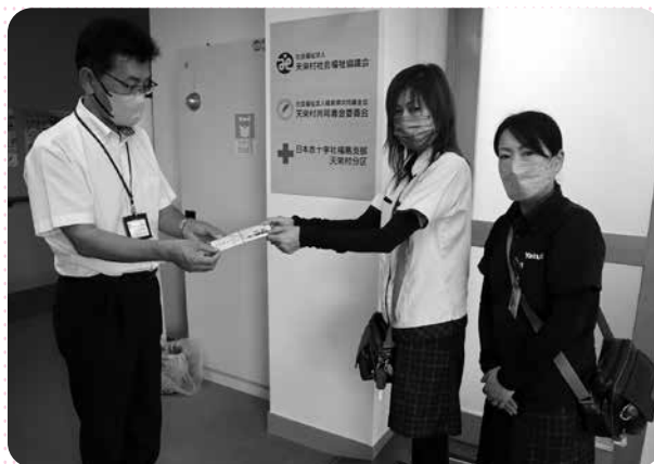
郡山ヤクルト販売(株)様