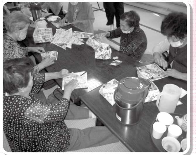
温泉の後はレクリエーション